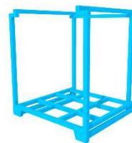
【ネスラック パレット保管】