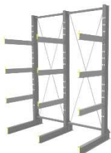
【カンチラック 長尺物保管】