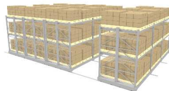
【パレトラック 移動式】