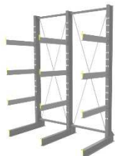
【カンチラック 長尺物保管】