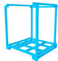
【ネスラック パレット保管】