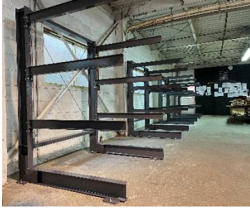
■ ボルト式カンチラック