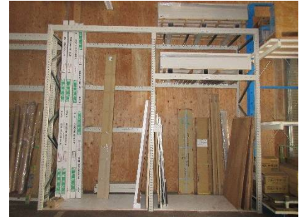
■ 固定式パレットラック