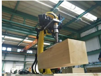
■ アーム式搬送産業ロボット