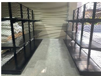
■ 什器・保管棚・陳列棚