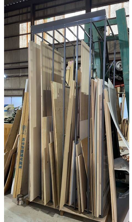
【波板用】 下部のみ合板を追加