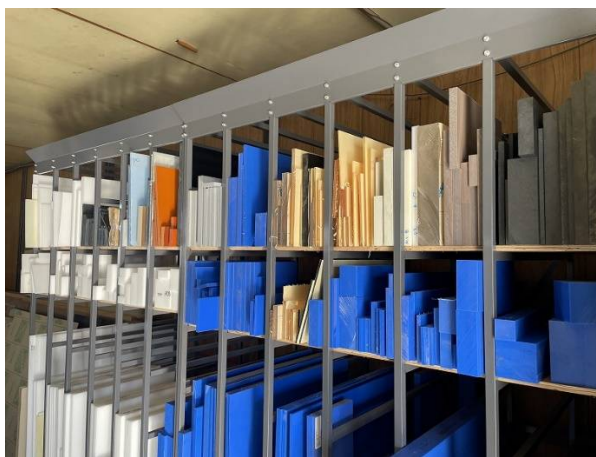
カット合板ラック