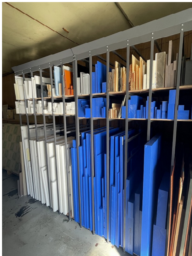
カット合板ラック